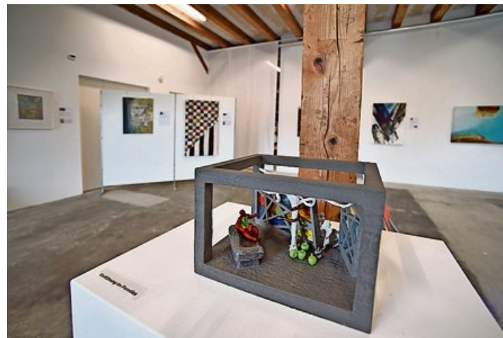
Neuinterpretation der biblischen Ursünde.